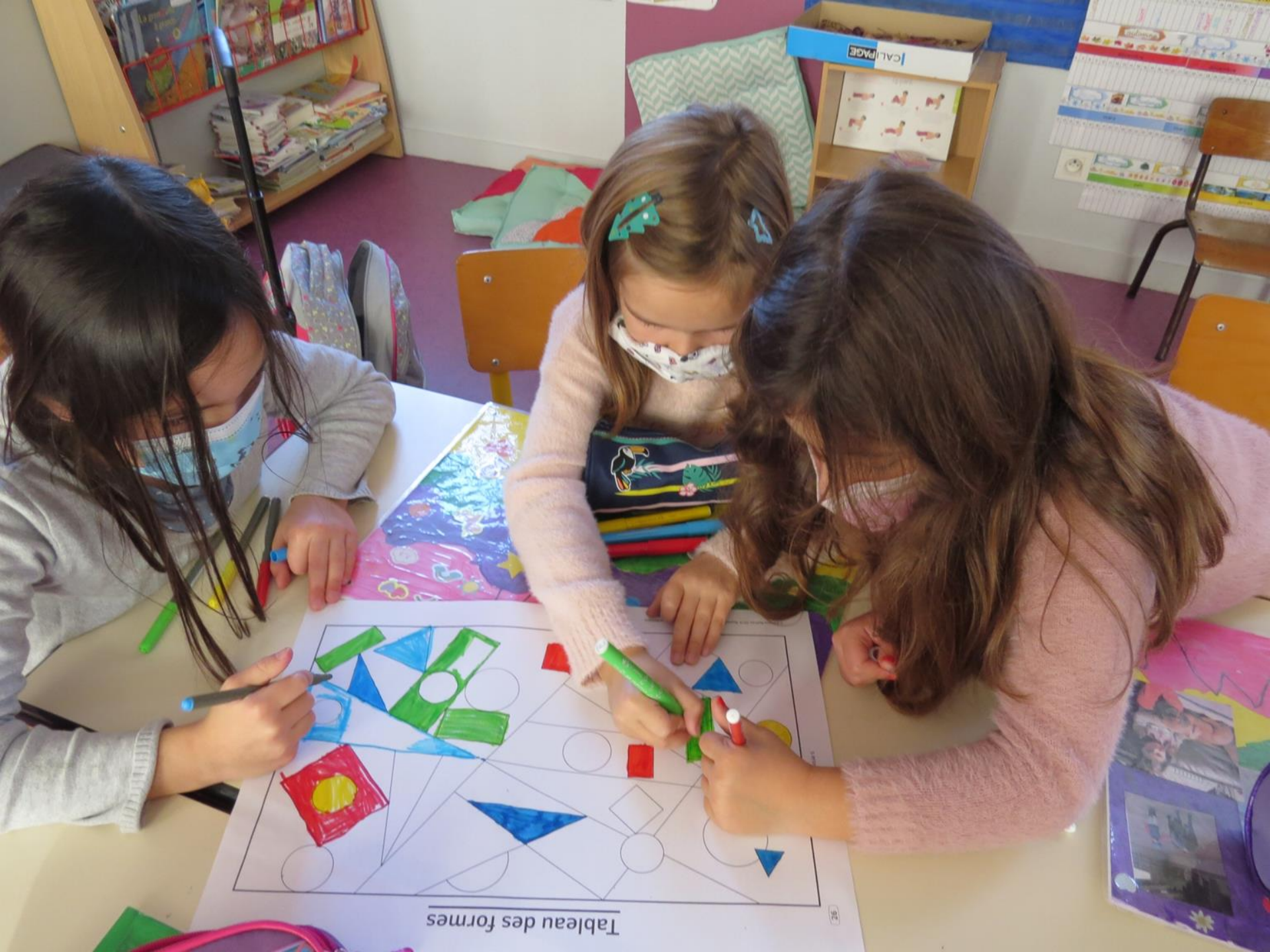
Tableau des formes