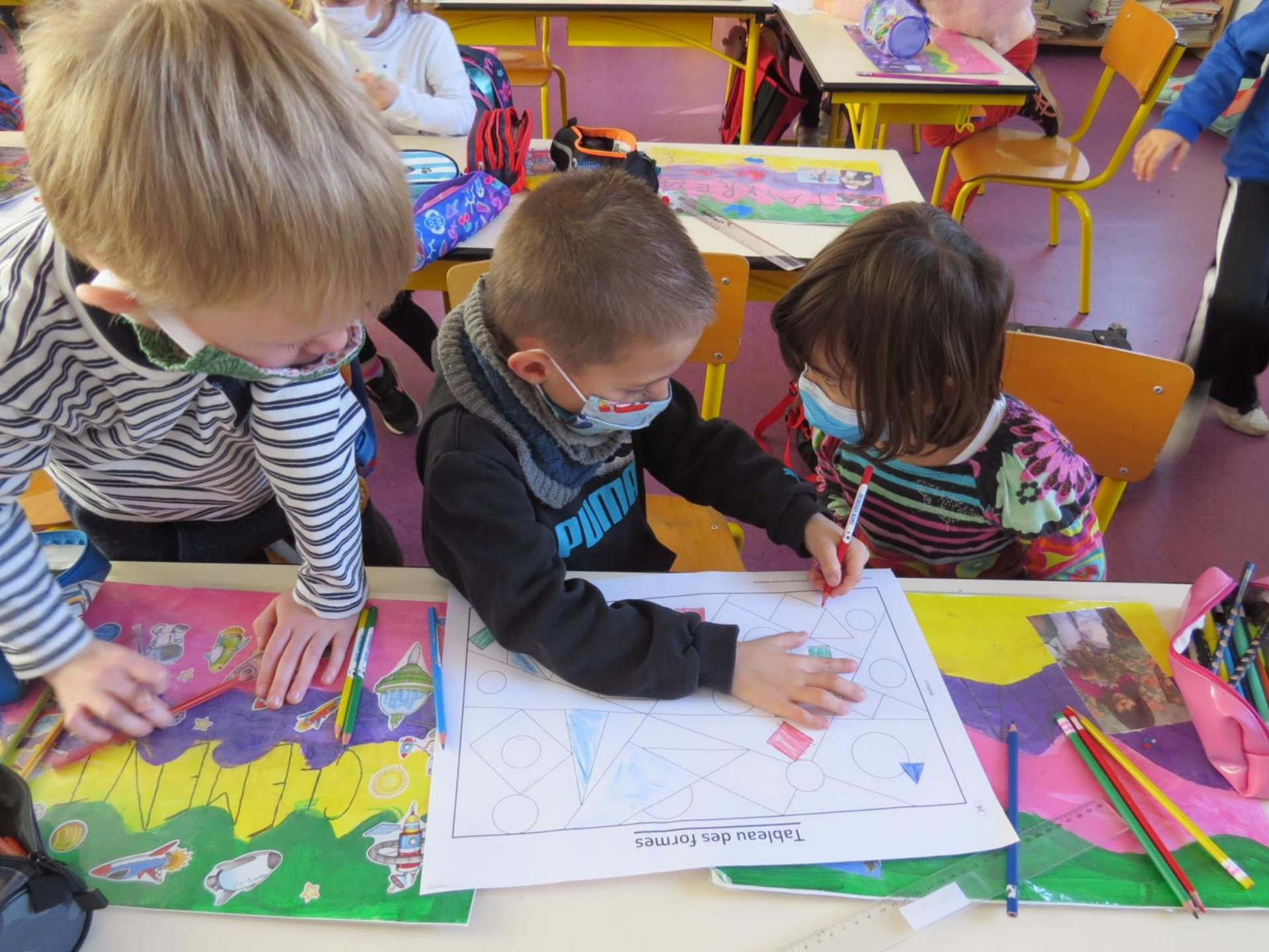
Tableau des formes